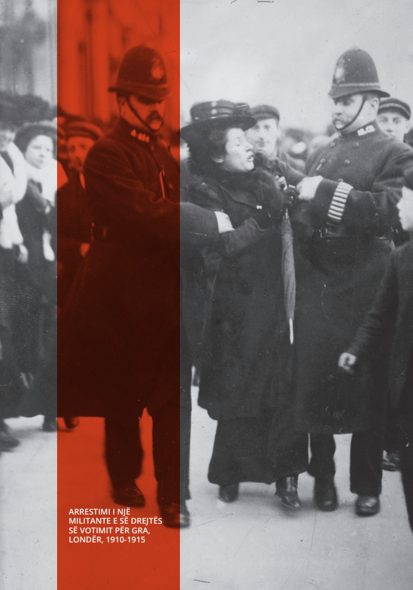
ARRESTIMI I NJË MILITANTE E SË DREJTËS SË VOTIMIT PËR GRA, LONDËR, 1910-1915