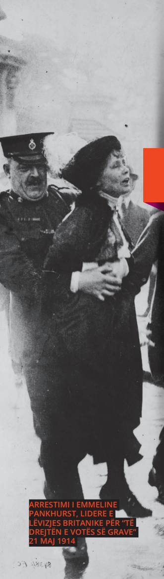
ARRESTIMI I EMMELINE PANKHURST, LIDERE E LËVIZJES BRITANIKE PËR "TË DREJTËN E VOTËS SË GRAVE" 21 MAJ 1914