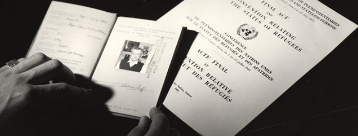
Dokumenti përfundimtar i Konventës së Gjenevës 1951.